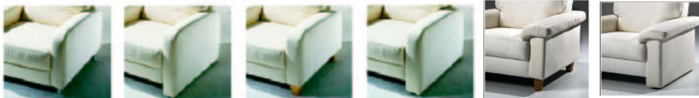
A (11 cm)