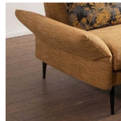
B - klappbar B. ca. 20 - 30 cm