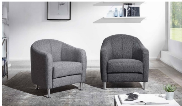
Cocktailsessel 715 und 716