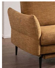
A - fest B: ca. 20 cm