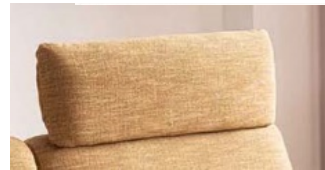
Kopfstütze breit verstellbar für S 100, EL 100, E 100 und LCH/L B / H ca. 90 x 30 cm