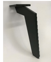
MF 23 ( schwarz ) MF 24 ( chrom )