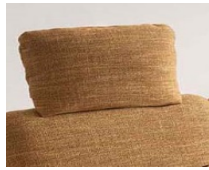
Kopfstütze Nr.9.1 verstellbar