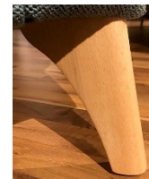
HF 340 - Buche in jedem Beizton lieferbar