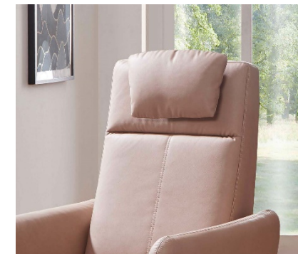
Rücken A - ohne Nackenkissen Nackenkissen ( Mehrpreis - siehe Preisliste )

Armlehne A ist preisgleich bodentief mit Rollen möglich