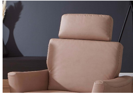
Rücken C inkl. einsteckbarer Kopfstütze